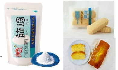
▲サンプリング品（イメージ）

◇11月15日（木）～11月18日（日） 各日12:00～13:00 ※なくなり次第終了