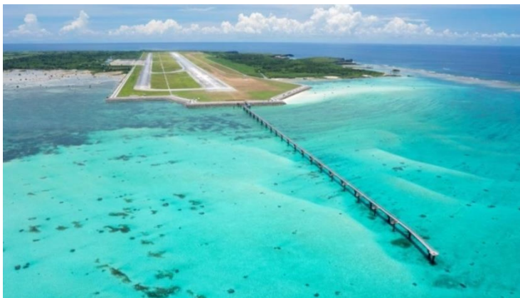
▲滑走路南側から見た下地島空港の様子

美しい自然・文化にあふれる宮古諸島への首都圏からの新たな路線の誕生を記念して、沖縄&宮古島名産品マルシェ、沖縄県名産品のサンプリング配布等、「宮古島に行きたい！」とつい感じてしまうようなコンテンツを用意します。