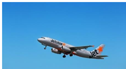
▲ジェットスター・ジャパン エアバス A320 型機