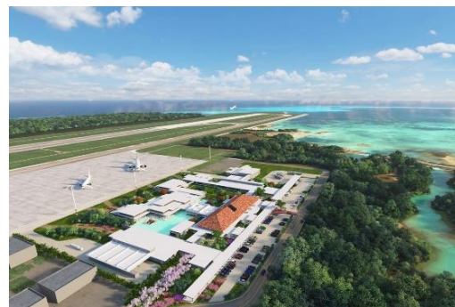
▲旅客ターミナル施設 外観完成予想 CG

国際線を受け入れる専用施設を設け、スムーズな入国・出国動線を確保する等、利用者の動線を意識した設計となっており、使い勝手の良さを追求しています。