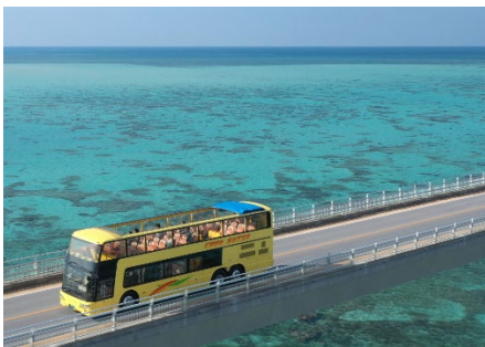
伊良部大橋を走行するオープントップバス

現在、下地島空港と宮古島市街地・リゾートホテル地区を結ぶみやこ下地島エアポートライナーは、途中、伊良部大橋を通過します。伊良部大橋は無料で通過できる日本最長の橋として2015年1月に供用開始し、トリップアドバイザーによる「旅好きが選ぶ！日本人に人気の水辺ランキング2020橋編」で1位を獲得するなど注目を集めています。その絶景を、風を感じながら直接眺められるのもオープントップバスの魅力のひとつです。