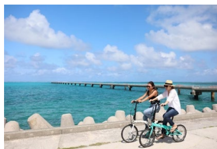
レンタサイクルイメージ

航空機をご利用いただくお客様以外も観光目的でお楽しみいただけるよう、オープントップバスをご利用されたお客様にみやこ下地島空港ターミナル内で貸出を行っているレンタサイクルの利用料金を200円引きと致します。