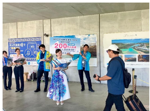
利用客数 200 万人を記念し、到着客歓迎イベントを実施(2025 年 10 月 1 日)